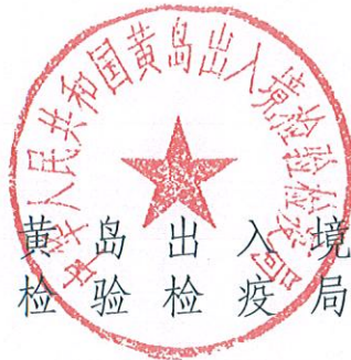
黄岛出入境 检验检疫局