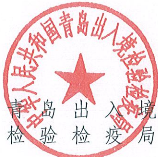
青岛出入境 检验检疫局