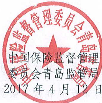
中国保险监督管理 委员会青岛监管局