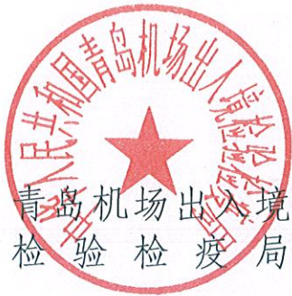
青岛机场出入境 检验检疫局