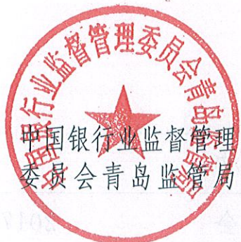
中国银行业监督管理 委员会青岛监管局