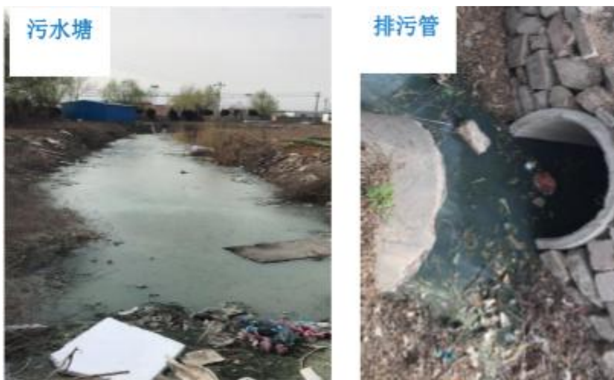
图 1-1 农村户内收水及户外排水现状图

为改善农村环境状况，山东省发布了《山东省农村人居环境整治三年行动实施方案》（2018-2020），推进户用卫生厕所建设和改造，鼓励东部地区、农村生活污水治理示范县和有条件的村庄推进改厕改水同步进行，建设分散式小型污水处理设施。《青岛市农村人居环境整治三年行动实施方案》明确提出：到 2020 年，55%以上的村庄对生活污水进行处理，其中农村生活污水治理示范县村庄污水处理率达到 80%以上；农村新型社区基本实现污水收集处理。《城阳区农村分布式污水处理设施建设工作方案》也指出：计划利用 2019 年至 2020 年两年的时间，在区域内短期内不能实施旧村改造且未配套市政管网的农村社区，配建污水管网及污水处理设施，进行污水收集处理，基本消除污水散排现象。