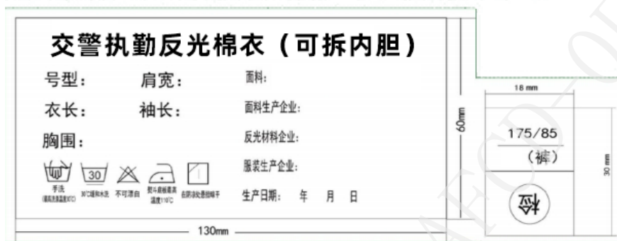
图 2 上衣号型、洗涤标志 图 3 裤子号型标志

交警执勤反光棉衣（可拆内胆） 交警执勤反光棉裤（可拆内胆）上衣应具有号型、洗涤标志，内容、规格如图 2 所示；荧光反光棉衣裤子上应具有号型标志，内容、规格如图 3 所示。