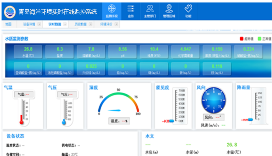
青岛海洋环境实时在线监控系统