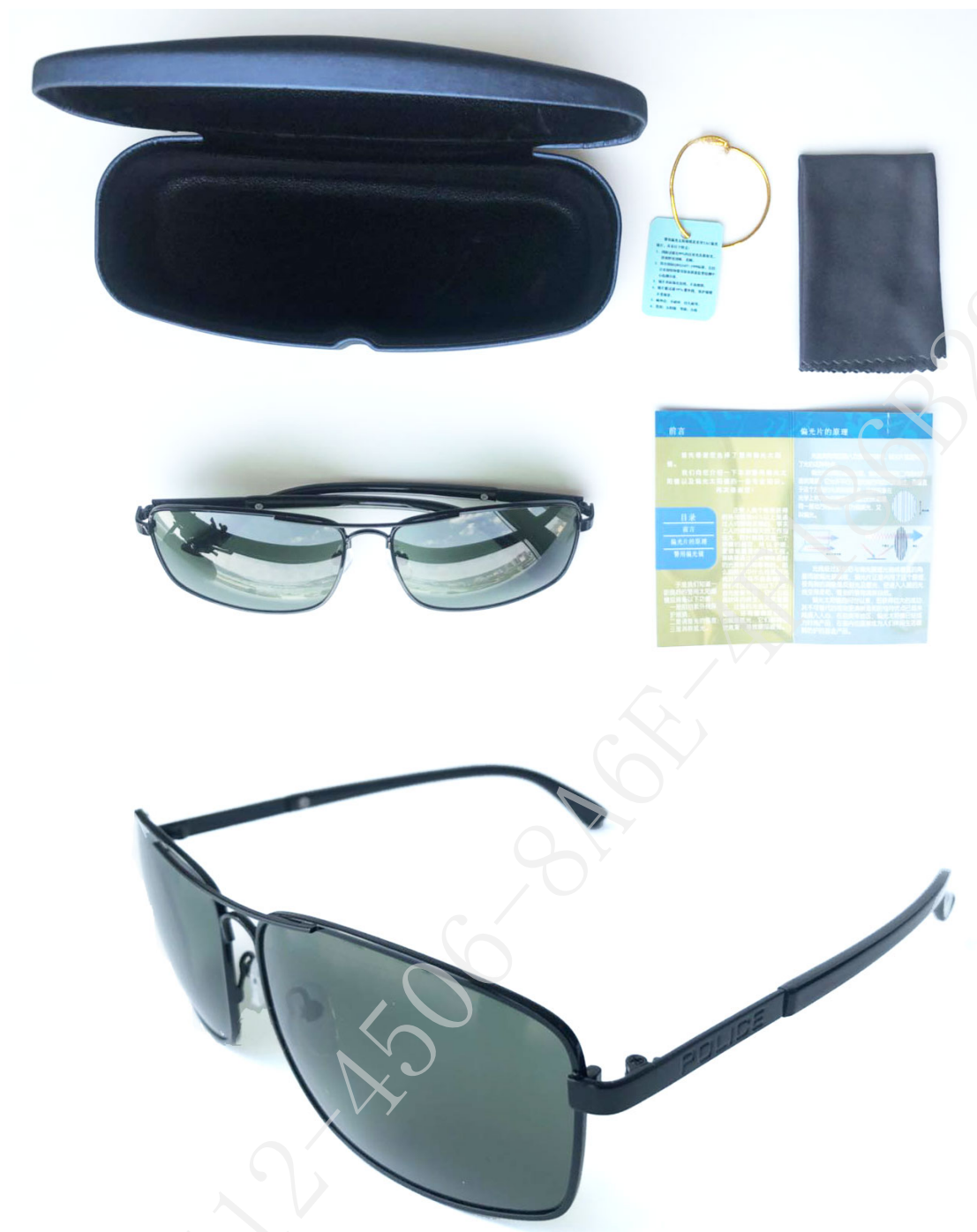
PC 镜片-警用女式太阳镜技术参数